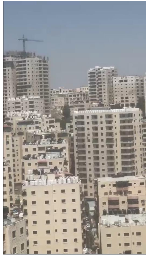
מכלי אגירת מים על גגות בתי כפר עקב

28. זאת ועוד. דומה כי כמות המים המסופקת לשכונה לא הולמת את העלייה החדה בכמות התושבים המתגוררים בה. במסגרת המחקר שערך מרכז המחקר והמידע של הכנסת לקראת כתיבת הדוח, והשאלות שהפנה לרשויות ולספקי המים בישראל, השיבה חברת מקורות, המשיבה 4, כי "בקשות לתוספות מים לרשות הפלסטינית צריכות להיות מוגשות לוועדה המשותפת למים Joint water commission ורק לאחר אישורה ניתן לפעול בהתאם" (דוח הממ"מ, עמ' 8). בקשת העותרים לקבל את ההסכם עם רשויות המים הפלסטיניות ונתונים על אספקת המים לא נענתה (ראו בהמשך הפניות למשיבים עובר להגשת העתירה).