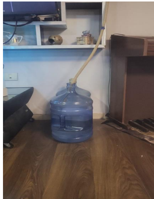
אגירת מים מתוך מזגנים, כפר עקב, יולי 2024