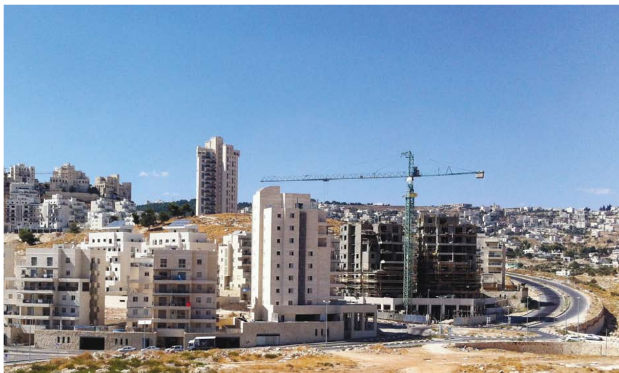
הרחבת הבנייה בהר חומה על רקע צור באהר בה התכנון והבנייה מוגבלים

זו ממשי ביותר, ותושבים רבים עצרו הליכי רישום או נמנעו מהם כליל אף בשטחים שאינם כלולים באזורי הסדר מקרקעין ובהם אפשרי לבצע הליך רישום ראשון.