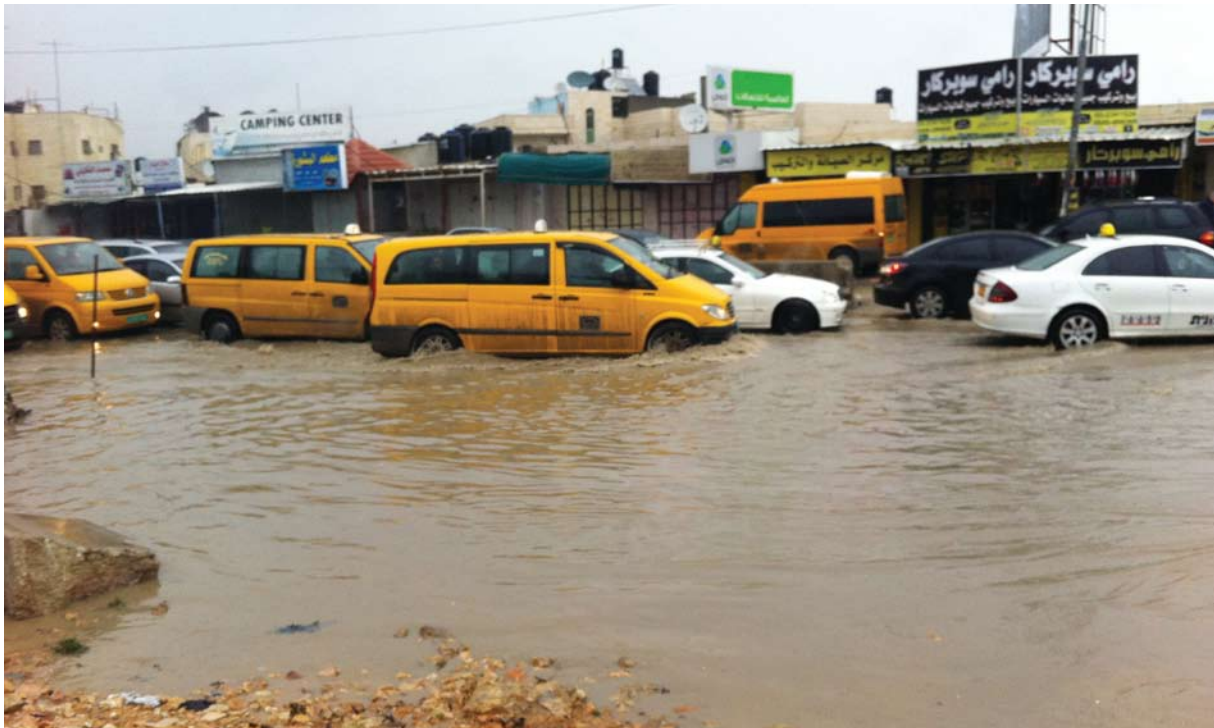
הכביש הראשי לכפר עקב, ליד מחסום קלנדיה

למתן שירותים, שכן היא מפנה את התושבים אל המנהל, אך, לטענתו, אינה מעבירה לו את התקציבים הנדרשים. רוב נציגי הרשויות שהשתתפו בדיון לא הכחישו את הטענות. נציגי שירותי הכבאות טענו שזמן התגובה שלהם כיום ארוך במיוחד וביקשו הקצאת קרקע ומבנה באזור קלנדיה להקמתה של תחנת כיבוי. 87