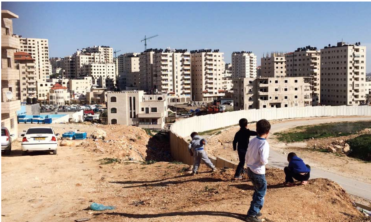
כפר עקב, מבט מגדר ההפרדה

המדיניות הישראלית נועדה להבטיח שליטה טריטוריאלית ישראלית בירושלים המזרחית, תוך הבטחת רוב יהודי משמעותי. שני ביטוייה הראשונים והבולטים היו סיפוח השטח והפקעת שליטתו ממנו לטובת הציבור היהודי ומניעת זכויות פוליטיות מהיחיד ומהקולקטיב הפלסטיני - דהיינו, היעדר מעמד אזרחי מלא והיעדר זכאות לבחור ולהיבחר למוסדות הקובעים את גורלם. 1 מטרתה של מדיניות זו הייתה ביצור החזקה הישראלית על ירושלים בהווה כמו גם בכל הסדר מדיני עתידי; המימוש המעשי שלה היה כרוך במהלכים העומדים בסתירה בולטת לערכים שעליהם הושתתה מדינת ישראל. כחלוף השנים הלכו סתירה זו וביטוייה המעשיים והקצינו, הן מבחינת המגבלות והאפילויות שמהן סובלים התושבים הפלסטיניים, הן מבחינת הפגיעה המחריפה בערכי השלטון והחברה בישראל.