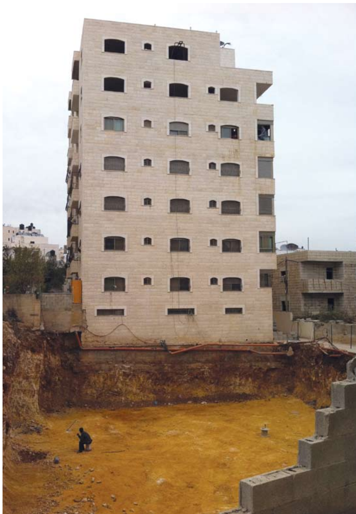
צפיפות בנייה, גרסת כפר עקב: בצמוד ליסודות הבניין החשופים כבר נכרה בור ליסודות בניין נוסף

המשוואה הזו כוללת שלושה מרכיבים רבי-עוצמה: זמינות של קרקעות לא מפוקחות, מצוקת דיור חריפה אל מול ביקוש עצום ואינטרס כלכלי של יזמים וקבלנים. אלא, שנעדר ממנה גורם מכריע אחד: הרגולטור. אף גורם ישראלי - מוניציפאלי או ממשלתי - אינו מנסה לאכוף את הכללים המקובלים בתחום זה: מניעת עבריינות, רישום קרקעות כדין, הוצאת היתרי בנייה ואכיפת סטנדרטים סביבתיים, תכנוניים והנדסיים, בכל האמור בבטיחות ובהקמת תשתיות והקצאת שטחי ציבור התואמים את סוג והיקף הבנייה.