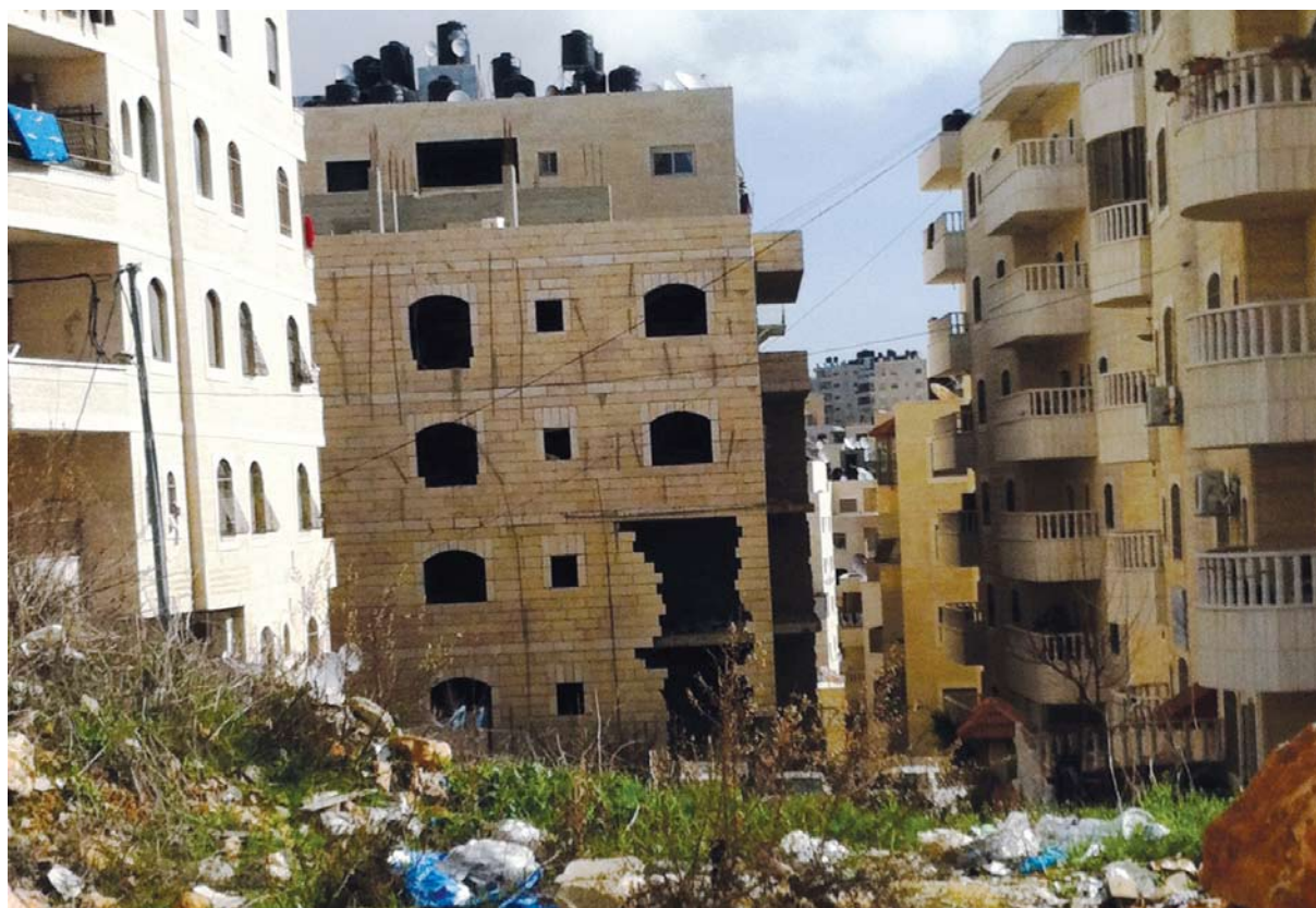
קריסת קיר בבניין בכפר עקב

בעקבות הקמת הגדר, החל תהליך בנייה מואץ בשכונות כפר עקב-סמיראמיס ובמחנה הפליטים שועפט וסביבתו. הבנייה המואצת נועדה לענות על הביקוש העצום לפתרונות דיור זמניים וזולים יחסית בקרב תושבי ירושלים המזרחית, שהתהליכים הפוליטיים והסוציו-אקונומיים דחקו אותם, כמפורט לעיל, משכונות הליבה אל מעבר לגדר. הביקוש העצום לדיור משך לשכונות יזמים וקבלנים שזיהו הזדמנות כלכלית נדירה, אשר קיבלה רוח גבית מן הפרצה הגדולה ברישום הקרקעות ובפיקוח על הבנייה והאכיפה (ראו פרק 1).