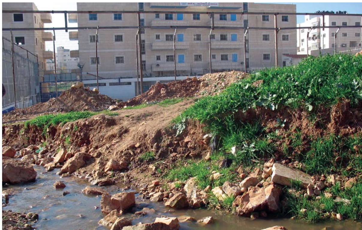
זרימת ביוב ליד בית ספר בכפר עקב

בעוד שירותים חינוכיים נעדרים, ישנן רשויות המגבירות דווקא את פעילותן. מאז 2003, משתמש המוסד לביטוח-לאומי בחברות פרטיות כדי לבצע חקירות בנוגע למעמד התושבות בשכונות שמעבר לגדר. החוקרים מלווים גם בשירותי אבטחה פרטיים. 95 מדובר בתחום בעל רגישות גבוהה ביותר (ראו פרק 1) והחקירות כרוכות בשאלות ובדיקות חודרניות בנוגע