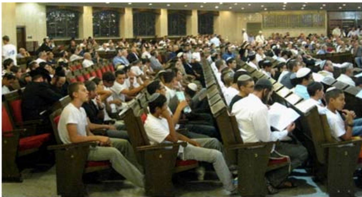
תמונה של הקהל מועידת המקדש ה-12 בבית הכנסת הגדול בירושלים.

אפיקי פעולה מרכזיים: התנועה פועלת למען הפצת והחדרת המושגים הר הבית ובניית המקדש לשיח הציבורי. היא קוראת לכל יהודי ויהודיה לעלות להר הבית על פי ההלכה וליטול חלק מעשי בקידום בניית המקדש וחיידוש העבודה. במסגרת קריאה זו, נערכת פעילות ענפה ומקיפה, להגברת המודעות לעליה להר הבית, על ידי הוצאת הירחון 'בנה המקדש' וארגון "ועידת המקדש", האירוע השנתי המרכזי של תנועות המקדש. התנועה לכינון המקדש מיוחדת בכך שנוסדה על ידי חרדים, ואחד מהמוקדים של פעולתה הוא עידוד עלייה של חרדים להר הבית.