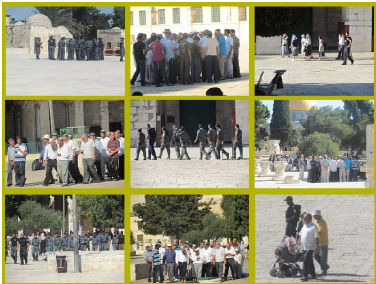
תמונות של קבוצות עולי רגל, רבנים וחיילים במדים, שפורסמו באתרים ערביים

כאשר עולות להר קבוצות של יהודים מקרב תנועות המקדש, מנסה המשטרה למנוע פעולות מצדם העלולות להיתפס כפרובוקציה או כערעור על ההסדרים הקיימים במתחם. במסגרת הסדרים אלה זכויות הפולחן באתר מוקנות למוסלמים בלבד, לכן אין אישור לבני דתות אחרות לבצע טקסים פולחניים, בכלל זה תפילות, השתחוויות, הקרבת קורבנות וכדומה.